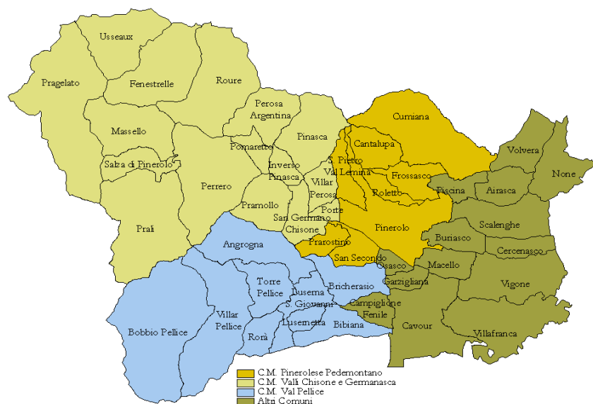
Fig. 2 Comuni suddivisi per Aree Omogenee (ex Comunità Montane)